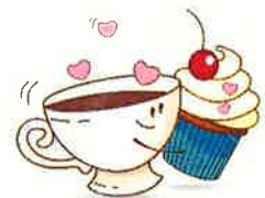
COFFEE & CAKE

We are looking for volunteers responsible for the Sunday coffee and bake cakes after Norwegian mass on Sundays. The list you can find in the parish hall.