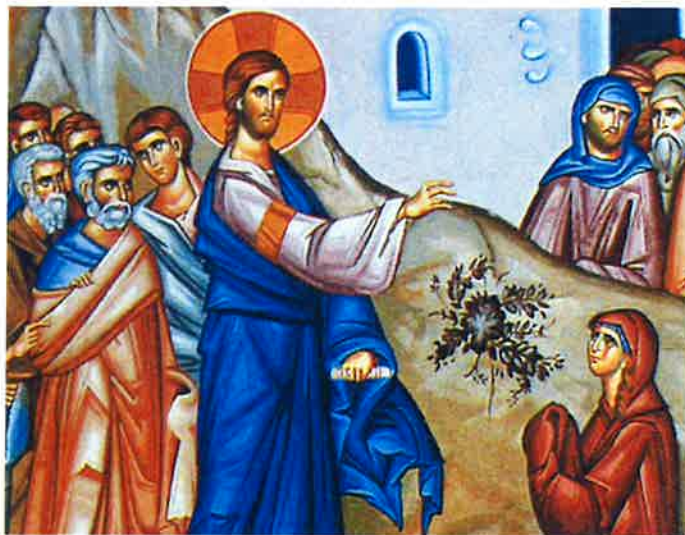
Pavens bønneintensjoner for august 2017 Kunstnere

At vår tids kunstnere må bruke sin sinnrikhet til å hjelpe alle med å oppdage skaperverkets skjønnet.